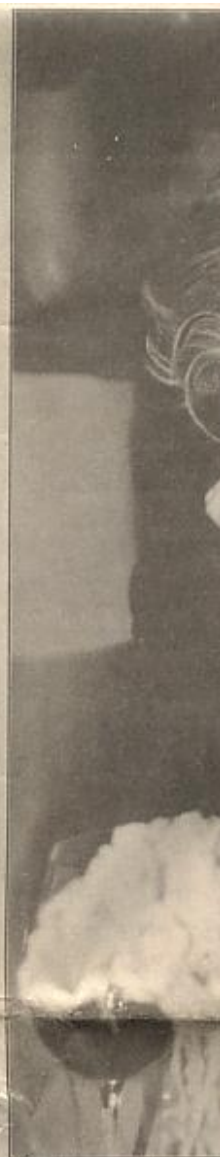
Costanza Pascoli trata de festas d